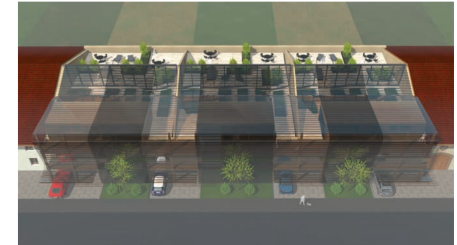
VUE D'ENSEMBLE - Échelle du projet adaptée aux volumes existants