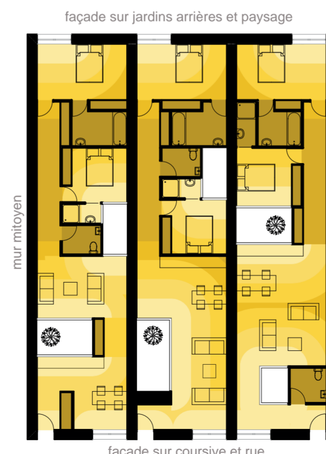
PLAN TYPE PROJET - Optimisation de l'espace disponible Travail sur la lumière et sur la distribution en longueur