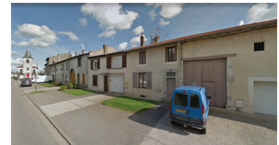
EXEMPLE D'IMPLANTATION POTENTIELLE - Sommervillers 54110