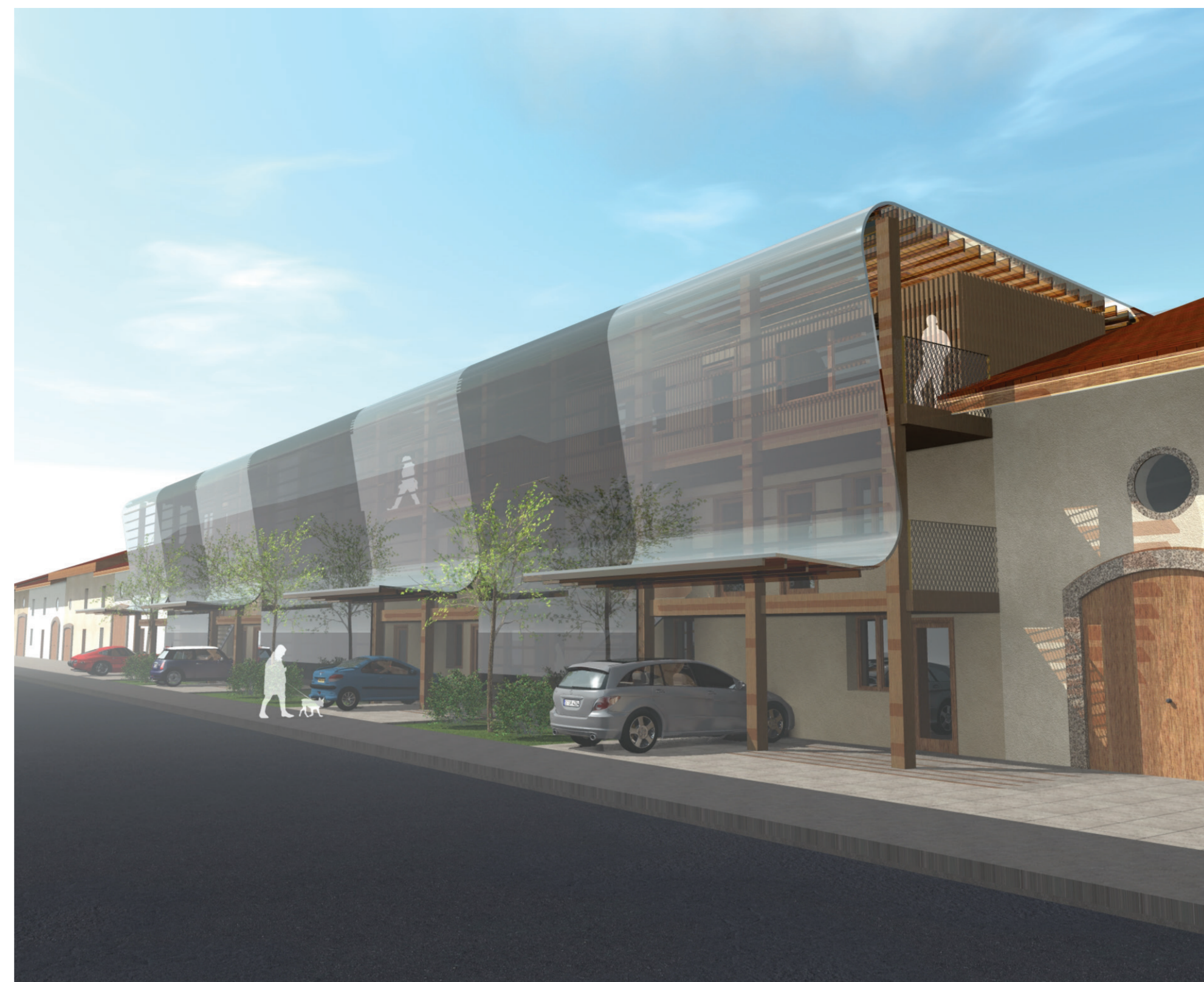
PERSPECTIVE DEPUIS LA RUE - L'espace de l'usoir retrouve une utilité par le dessin d'une façade contemporaine : coursives, carports et double peau.

Les villages lorrains ont la spécificité d'être des villages-rues. Le système proposé pourrait se répéter sur des longueurs variables et ainsi redonner vie aux coeurs de village. Le plan demeure très adaptable permettrait d'accueillir des primo-accédants cherchant à s'installer à proximité des grandes villes, des familles en quête de tranquillité, des retraités, ou encore des résidences semi collectives pour seniors autonomes.