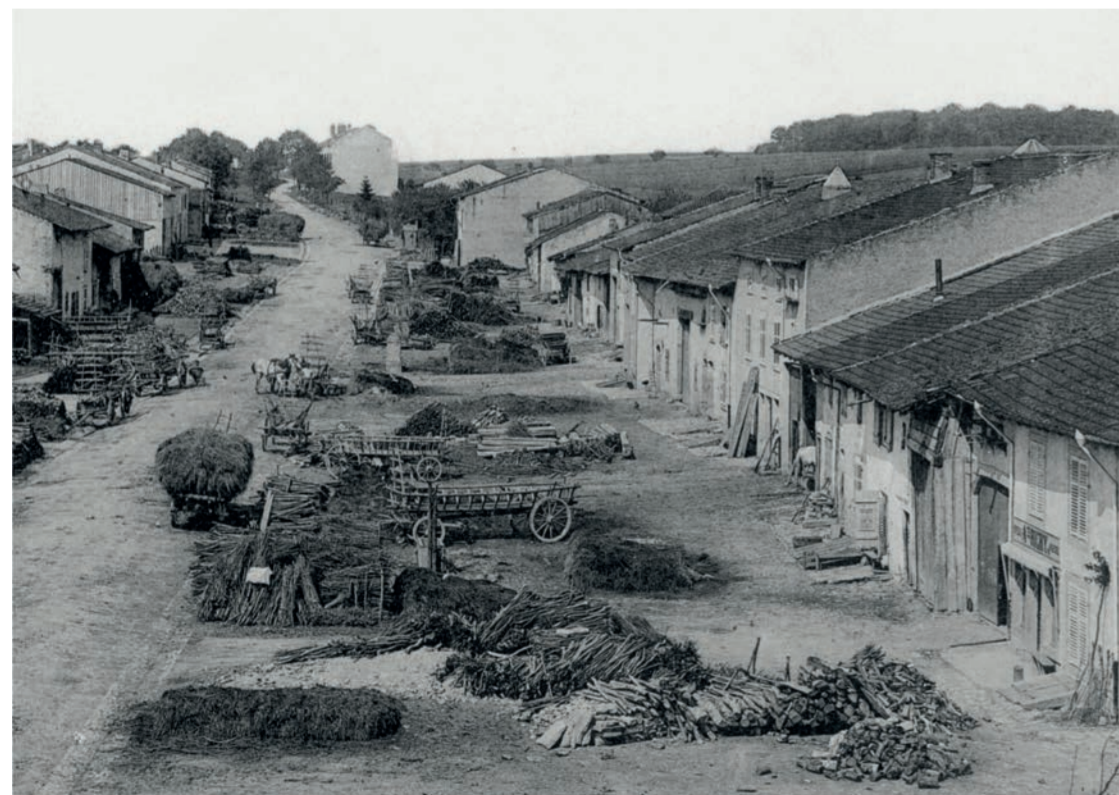
PHOTO ANCIENNE - Village-rue au XXe siècle : espace dit de l'usoir et front de fermes