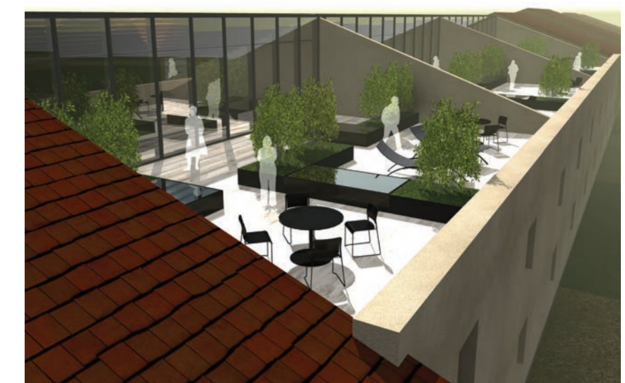
TERRASSES EN FACADE ARRIERE - Ouverture sur le paysage